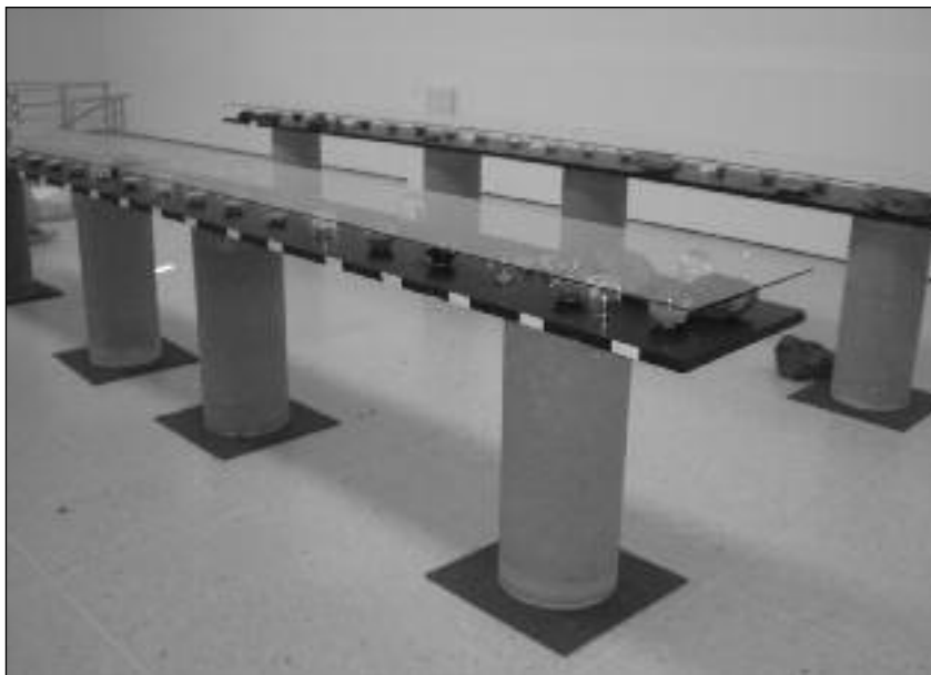
Himmelblau und Abendrot. 2007, zum Anlass des 50-Jahr-Jubiläums der Zuger Kunstgesellschaft, konzipierte und realisierte das Zuger Privileg eine Ausstellung im Kunsthaus Zug zum Thema "Woher die Farben kommen".

Schon die erste Veranstaltung im Januar 1999 zeigte, was mit dem besonderen Blick auf unsere Alltagskultur gemeint ist. In der damals neu eröffneten AndreasKlinik in Cham wurden Arztromane vorgelesen und analysiert. Kein „gebildeter“ Mensch